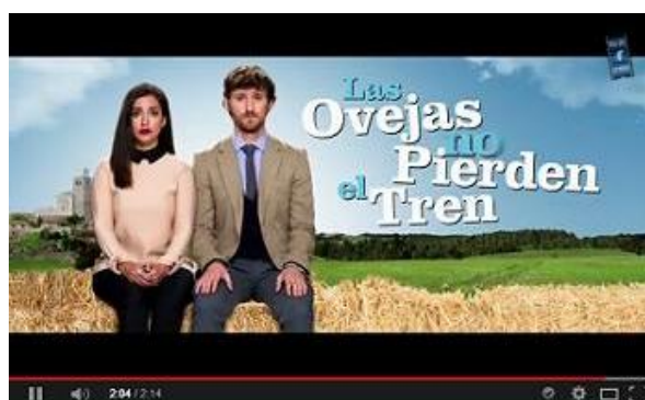
LAS OVEJAS NO PIERDEN EL TREN , de Álvaro Fernández Armero Morena Films